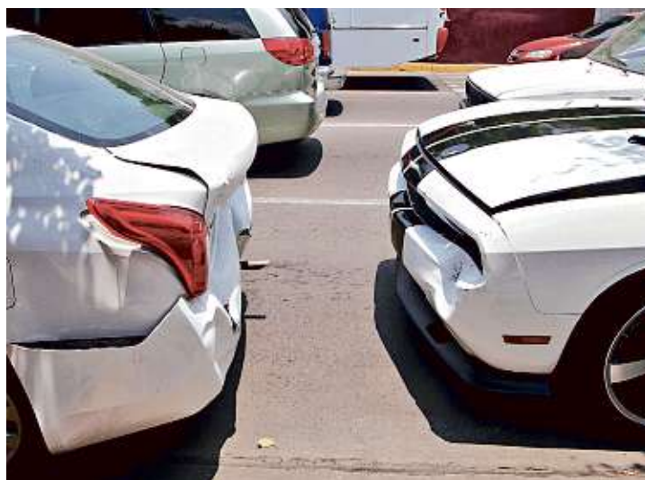
Los alcances leves complican la vialidad, porque las aseguradoras piden no mover los autos hasta que sus ajustadores tomen fotos.

de los choques viales tienen lesionados, y debe tomarse su tiempo el retiro de autos.