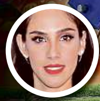
María / Sandra Echeverría