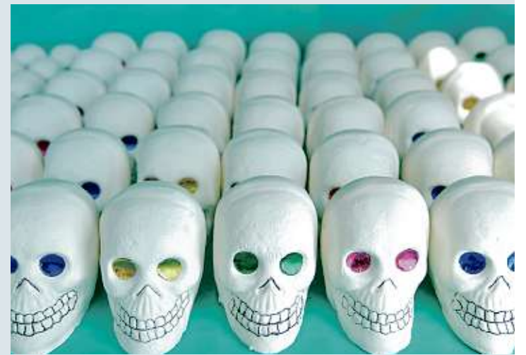
También se venden calaveras de azúcar, para conmemorar el Día de Muertos, que se celebra el 2 de noviembre.

Junto a ella, los vendedores de calaveritas de dulce y papel picado están también instalándose, aunque los mejores días de venta para ellos