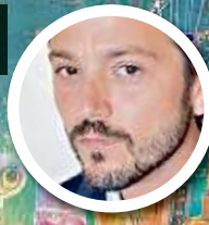
Manolo / Diego Luna

JUEVES 16 / OCT. / 2014 / GUADALAJARA, JALISCO / 50 PÁGINAS, AÑO XVI NÚMERO 5,796 $10.00