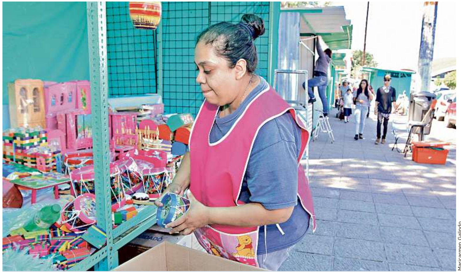
Los vendedores de artesanías de madera y cartón se instalan anualmente en el Parque Morelos durante octubre y noviembre.

Con los estudios, señaló, pretenden conocer los posibles daños que tendrían edificios históricos del Centro y verificar si hay vestigios históricos.