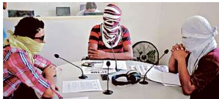
Normalistas tomaron una radio para emitir un comunicado en el que exigen la aparición con vida de sus 43 compañeros.

El descontento entre perredistas ha aumentado ante la descomposición política en la