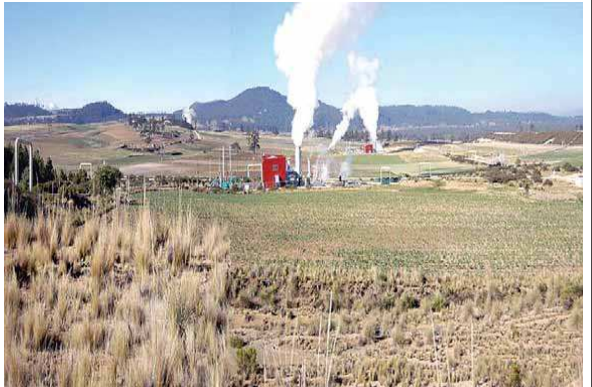
Aprovechamiento geotérmico en Cerro Prieto, Baja California, el mayor del país

finales de la formación de la cercana caldera volcánica de La Primavera. El domo presenta un cráter de explosión en cuyo interior hay fumarolas con temperaturas superficiales máximas de 90 grados centígrados [°C] y en cuyo borde suroeste se encuentran manantiales con temperaturas de hasta 67°C y contenidos de boro de hasta 13 ppm [partes por millón], que pueden considerarse como una descarga lateral del probable yacimiento geotérmico del subsuelo.