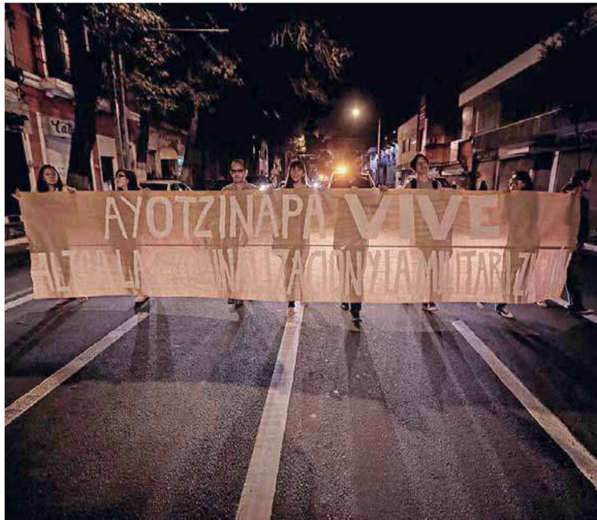
“Guerrero aguanta, Jalisco se levanta” gritaron los miembros de la Coordinación Ayotzinapa Somos Todos