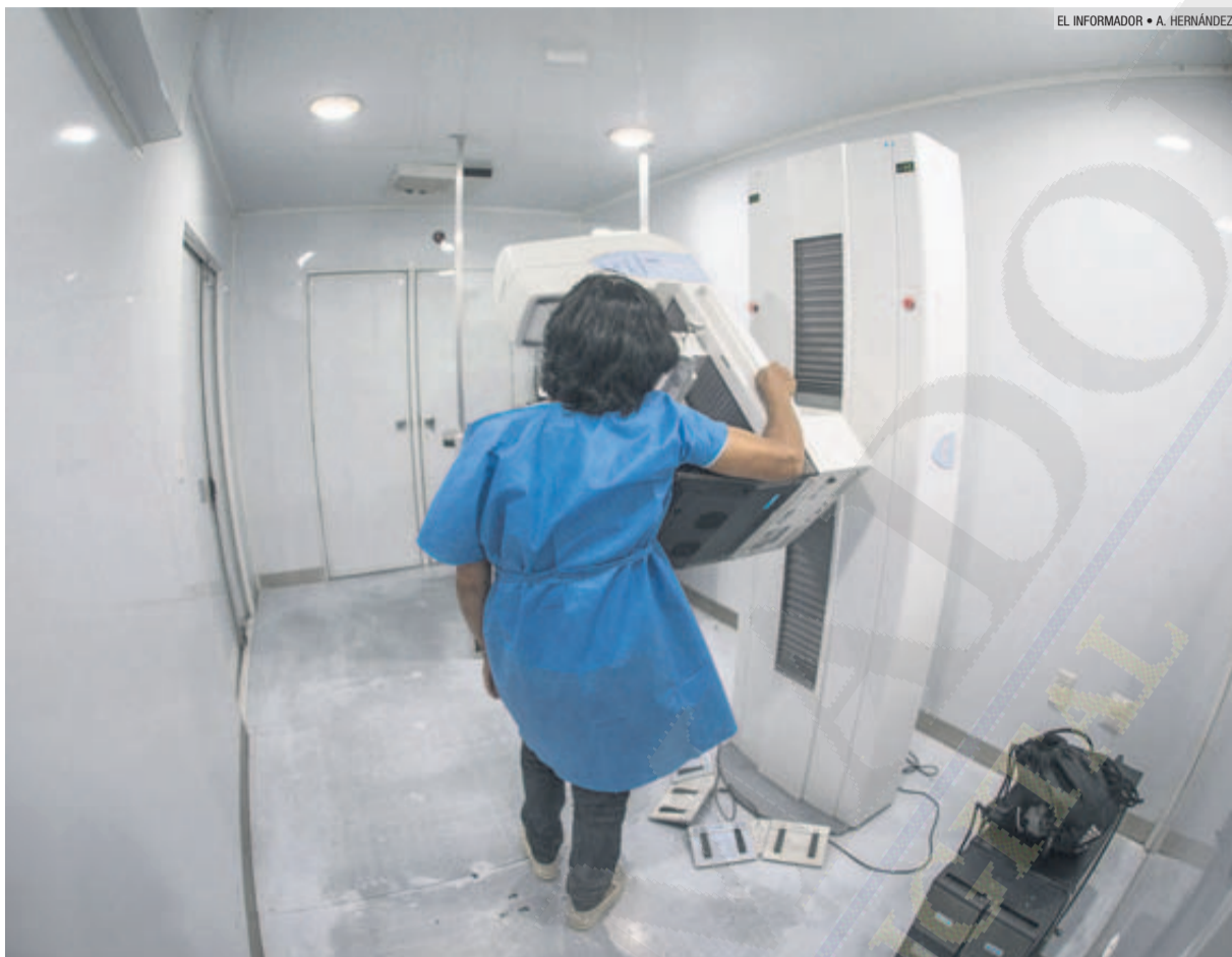
MÁS VALE PREVENIR. Una mujer se somete a una mamografía en uno de los módulos gratuitos que se han instalado en las Fiestas de Octubre. La detección temprana del cáncer de mama es fundamental para aumentar la supervivencia a la enfermedad.