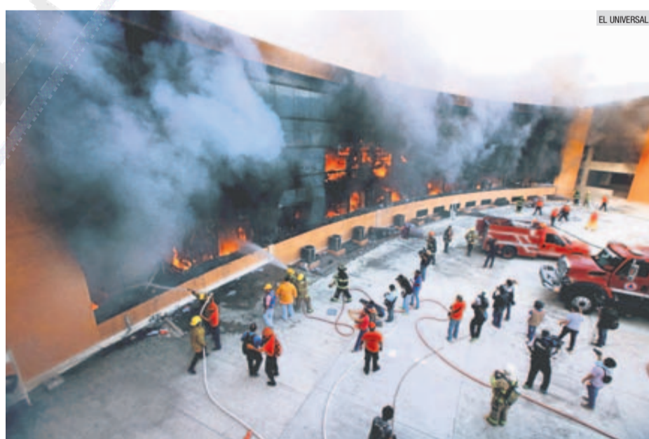
EN LLAMAS. Los estudiantes de Ayotzinapa rompieron los vidrios y lanzaron artefactos explosivos.

La autoridad sanitaria también terminó con el padrón de este tipo de espacios, dando como resultado que en Jalisco existen 375 guarderías y 408 estancias infantiles.