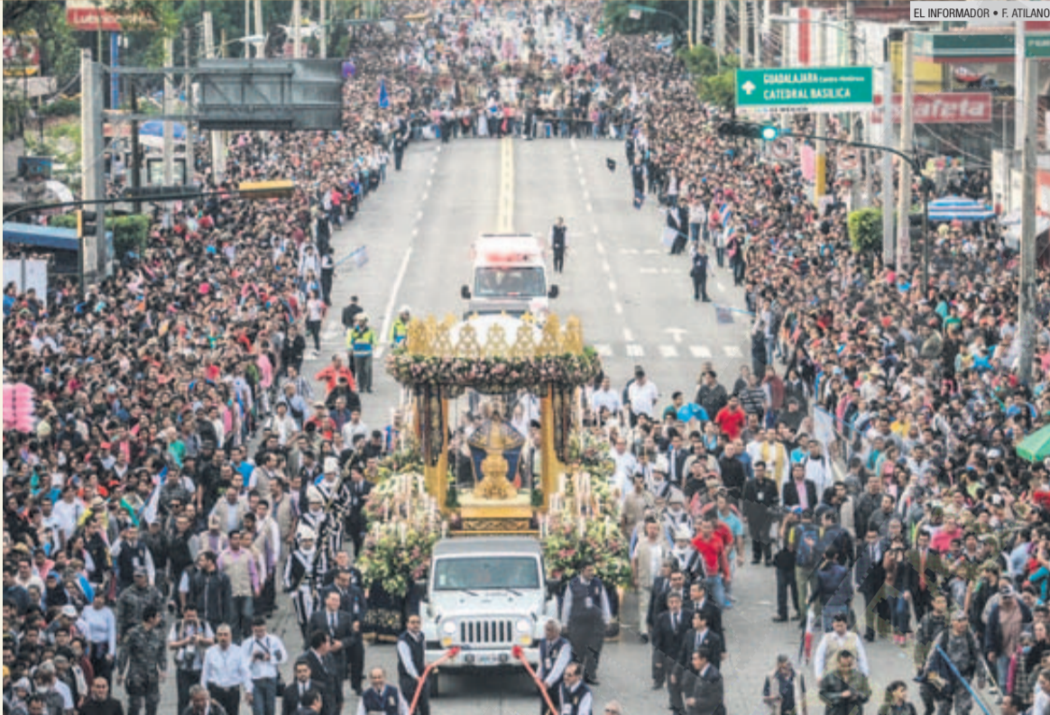
VENERADA. La Virgen de Zapopan regresó a su nicho escoltada por miles de fieles seguidores.