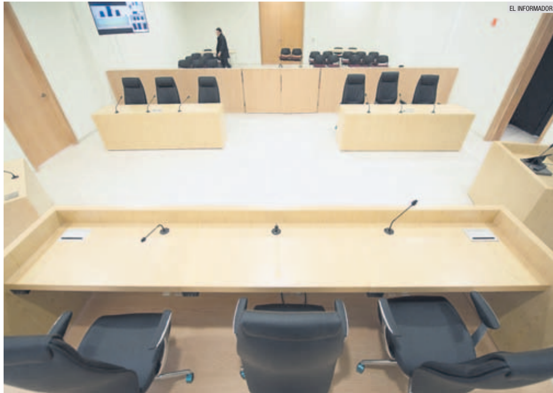
FLAMANTE. Una sala del Juzgado Penal de Control y Oralidad, del Sexto Distrito Judicial, Zapotlán El Grande.

El nuevo sistema de justicia acusatorio permite resolver un caso que habría tardado 22 meses