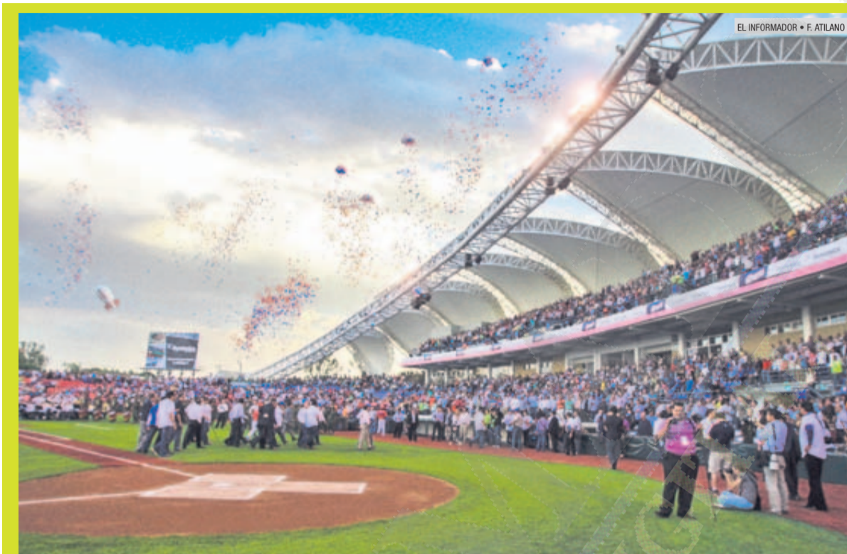
UNA FIESTA. La Liga Mexicana del Pacífico reportó la asistencia de más de 11 mil 500 aficionados ayer al juego inaugural.