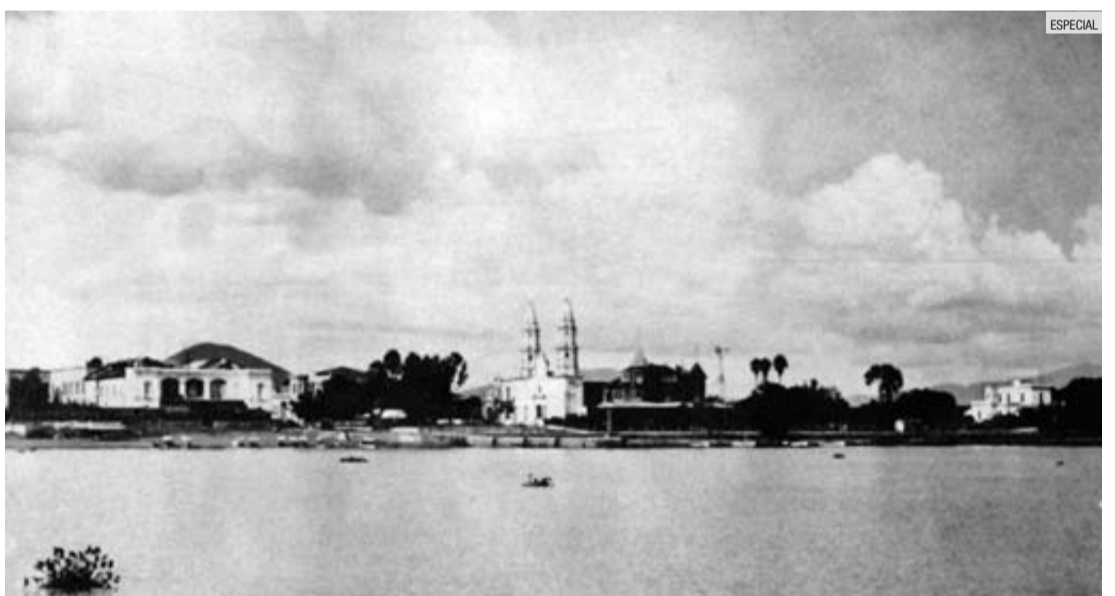
OTROS TIEMPOS. El cuerpo de agua en la década de 1920.

El pueblo de Chapala es un caso muy particular entre las poblaciones originarias que bordean la laguna de Chapala, y aún entre todas las poblaciones de Jalisco. Fue un tranquilo asentamiento indígena desde su consolidación por la orden de los franciscanos a partir del siglo XVI. A partir de los principios del siglo XX fue descubierto como lugar de descanso y veraneo por parte de la gente de Guadalajara y aún de México. Es conocida la aventura, hacia 1920, del noruego Christian Schejtan para implantar la comunicación ferroviaria entre Guadalajara y Chapala, así como el establecimiento de una red de transporte lacustre a otras poblaciones ribereñas.