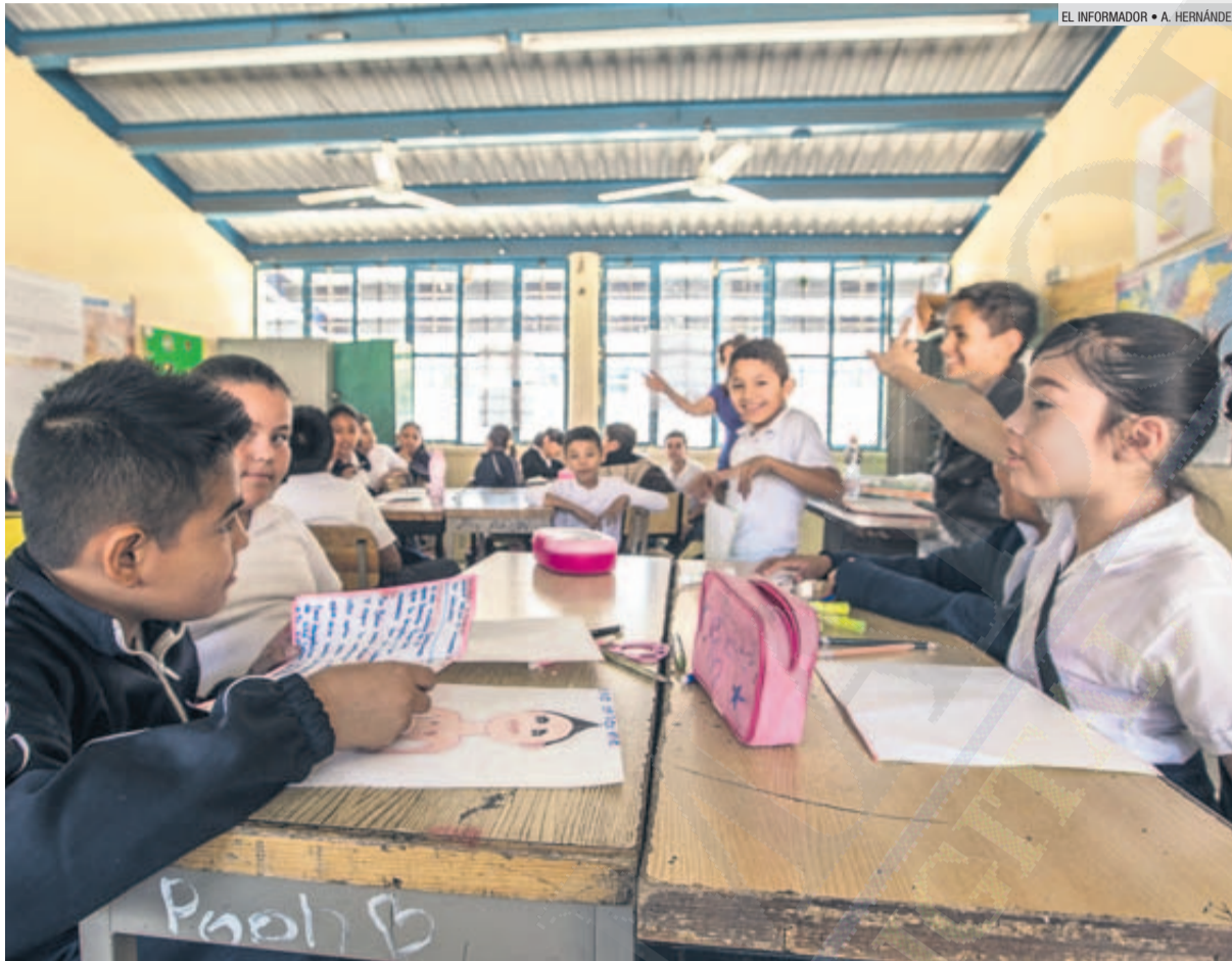
IDENTIFICACIÓN GRATUITA. En este ciclo escolar se entregarán un millón y medio de credenciales gratuitas para los estudiantes de educación básica, con la que podrán acceder a transporte y bibliotecas, entre otros.