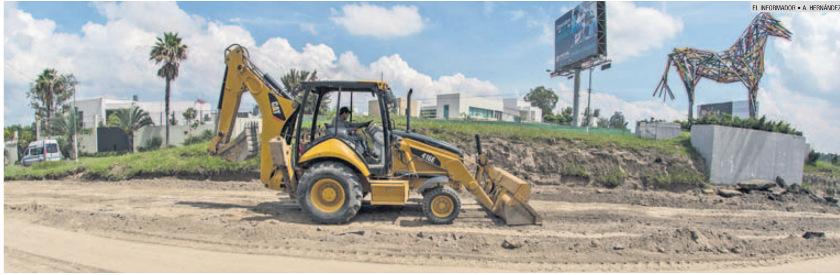
NIVELACIÓN. Una pala mecánica en la vía en sentido Poniente-Oriente, sobre la Avenida Acueducto.