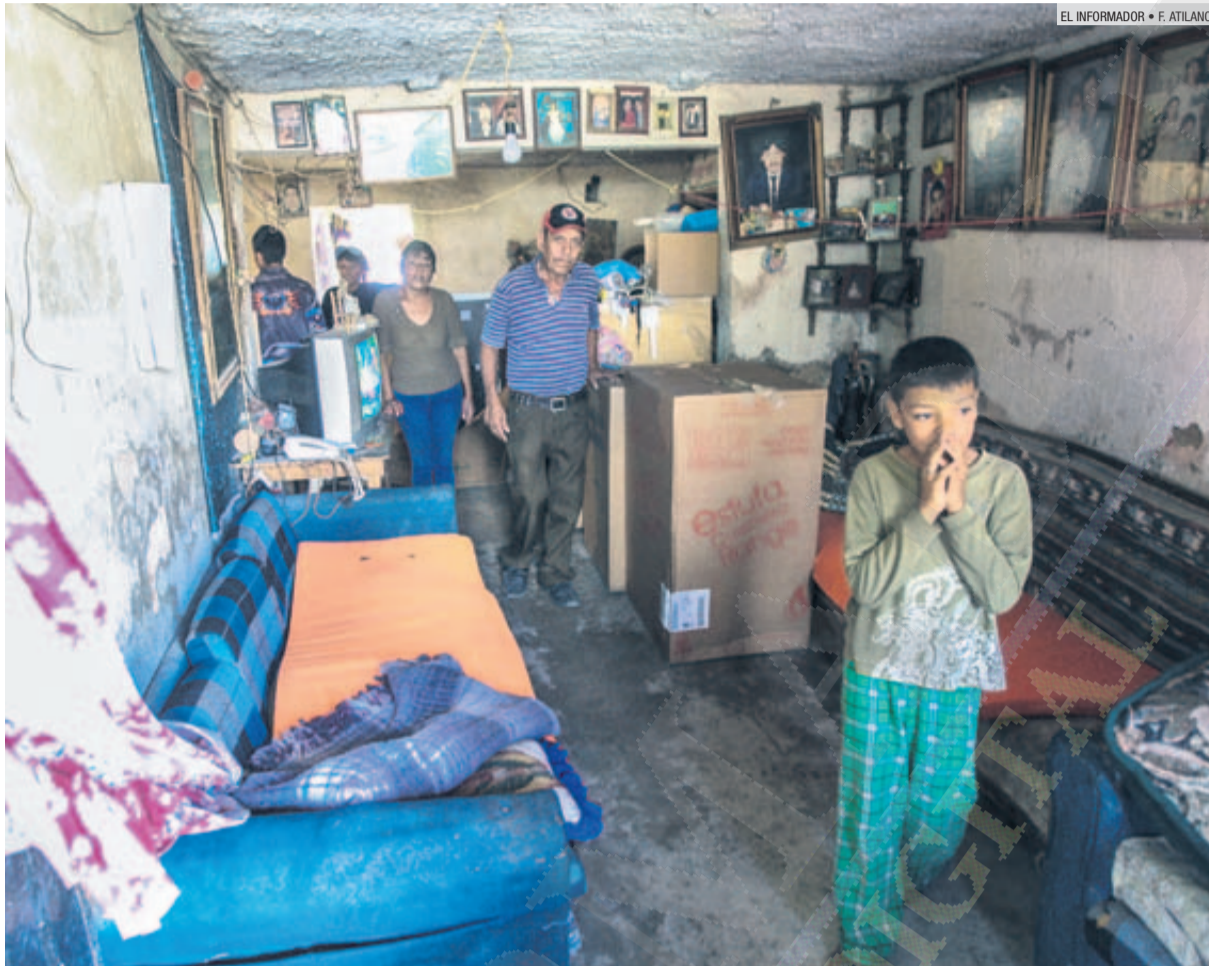
AYUDA. Una familia de la colonia Ojo de Agua, en Tlaquepaque, recibió enseres domésticos como parte de los apoyos para tratar de mitigar la afectación por la inundación que sufrieron la semana pasada.