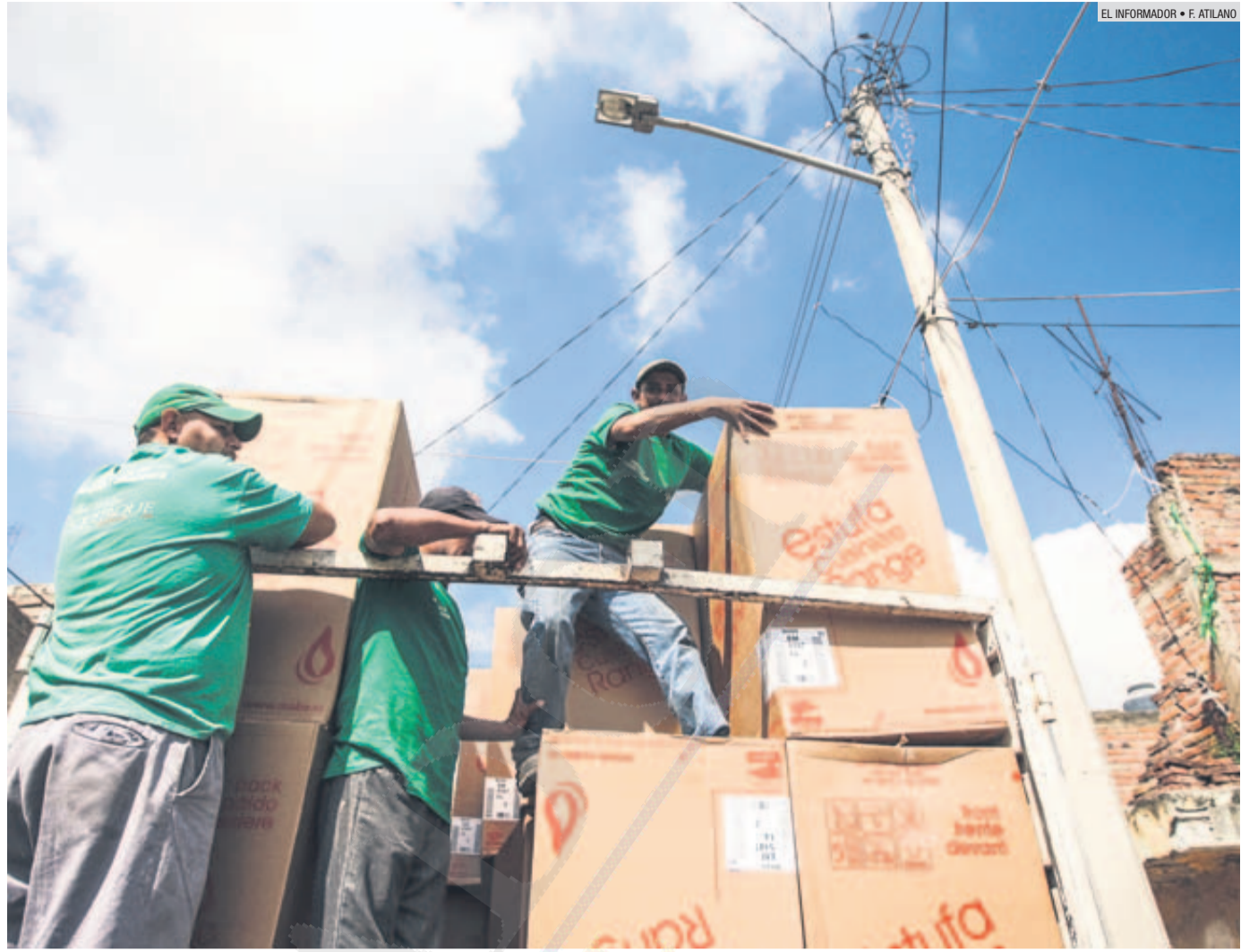
OJO DE AGUA. Personal descarga estufas empacadas para ser entregadas a las familias afectadas por la lluvia en Tlaquepaque.

“Yo tengo el presupuesto de millón y medio de pesos para desastres. Pero existe el Fonden, que son recursos federales y estatales de donde se está echando mano para este tipo de problemas”.