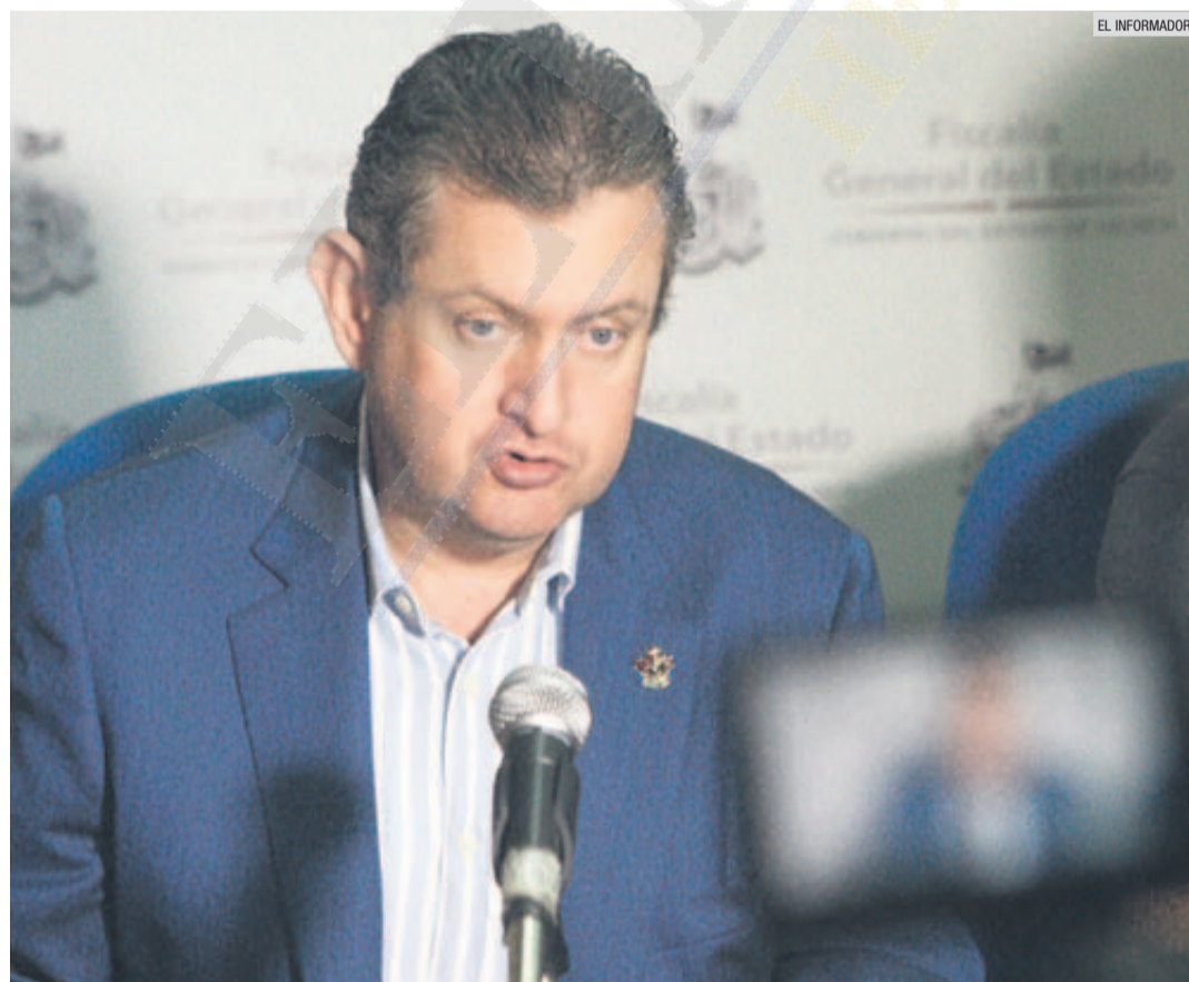
LUIS CARLOS NÁJERA. El fiscal general de Jalisco dijo desonocer los nombres de los mandos policíacos que no acreditaron las pruebas de control y confianza.

El despido de cerca de cinco mil policías que no acreditaron su evaluación en los exámenes de control y confianza no preocupa a la Fiscalía del Estado. Para el titular de esa instancia, Luis Carlos Nájera, no hay razón para asegurar a este punto una crisis de seguridad después del 30 de octubre (fecha límite para dar de baja a los oficiales no aptos, según la evaluación).