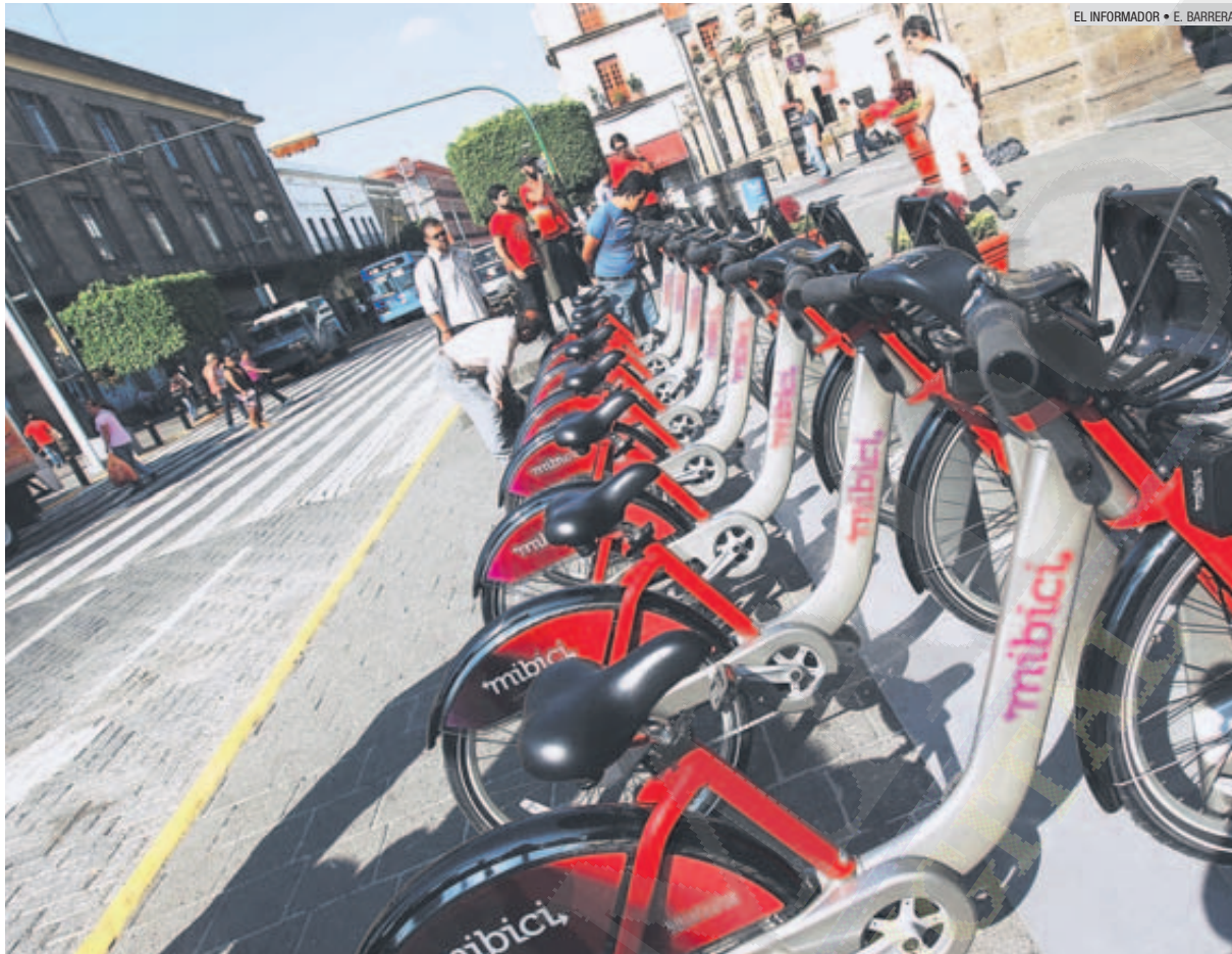
A PEDALEAR. Hoy comienzan las preinscripciones a la bicicleta pública en Guadalajara, llamada MiBici. Sólo habrá 10 mil suscripciones disponibles para utilizar 860 velocípedos en su primera etapa.